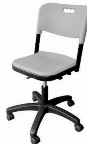
ШС19 (опора пластик)