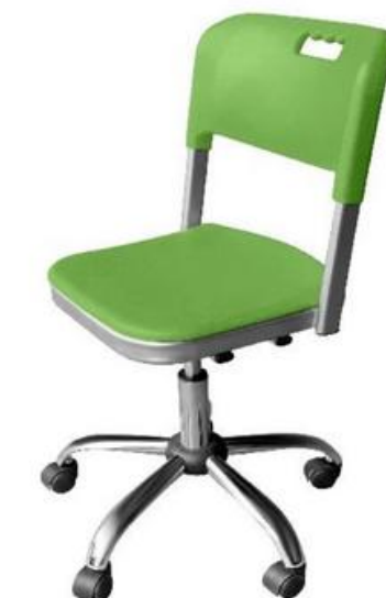
ШС20 (опора хром)