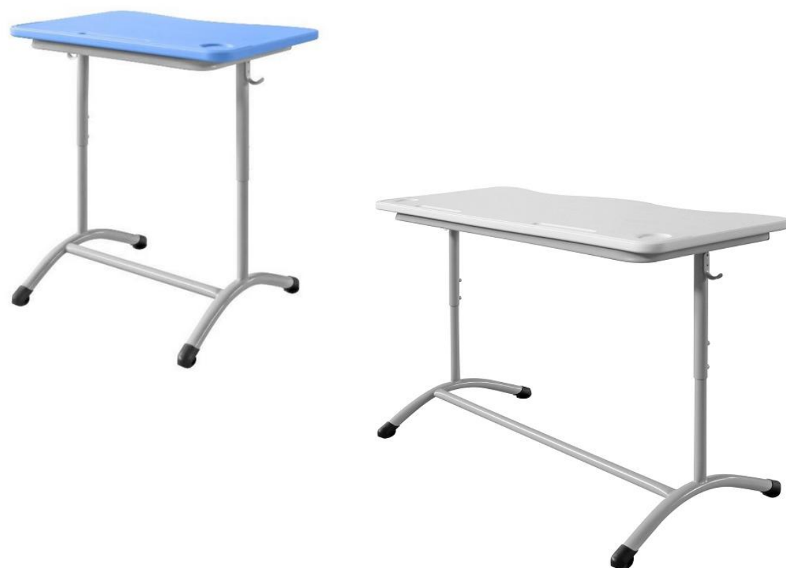
ШСТ11 и ШСТ12

Размер 1 местной столешницы 500*700 мм Размер 2 местной столешницы 500*1200 мм