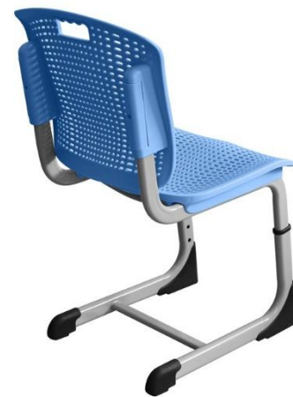
ШС08 (5-7 гр. роста)

Ширина 500 мм Глубина 540 мм Высота спинки от 755 до 835 мм