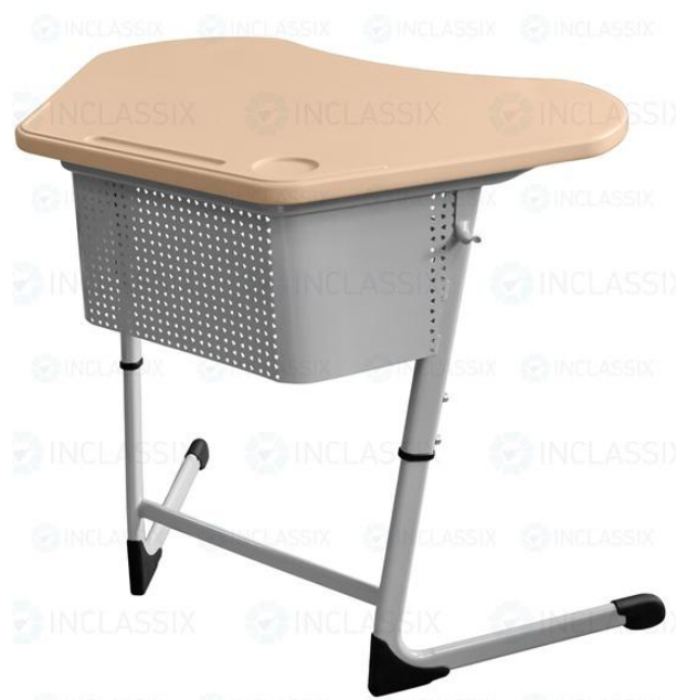
ШСТ75 столешница пластик