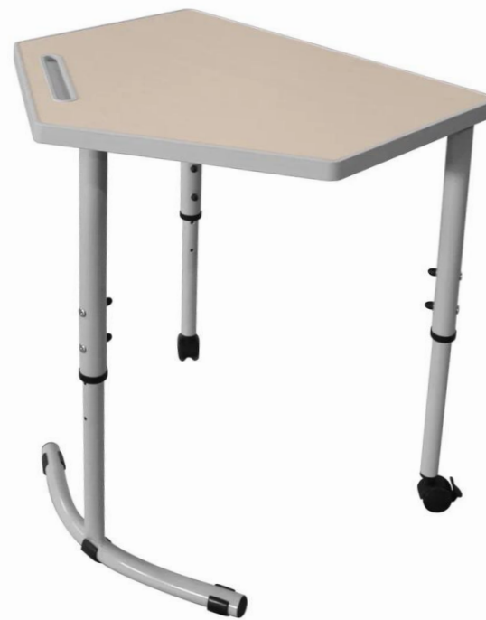
ШСТ59 (МДФ с литой кромкой)