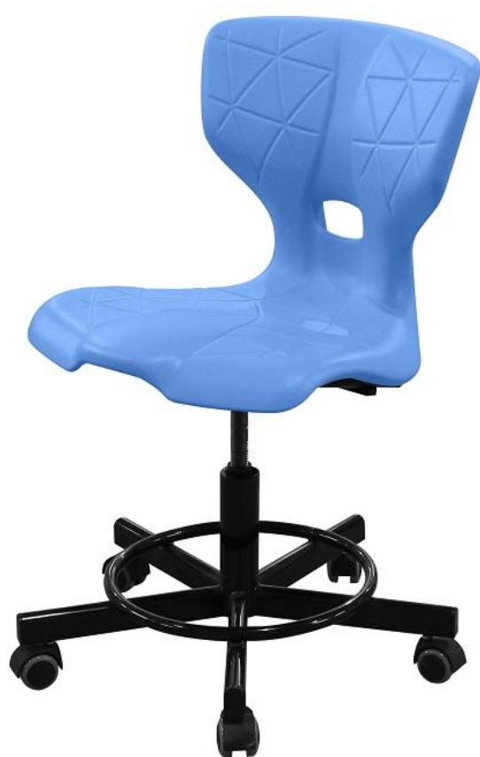
ШС14 винтовая опора

Все три модели добавлены в Реестр Минпромторга РФ и имеют по 90 баллов