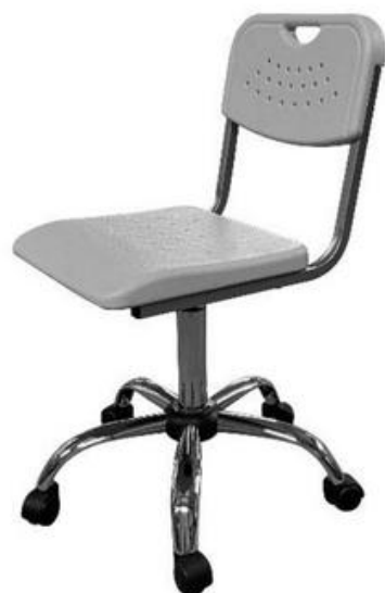
ШС16 (опора хром)