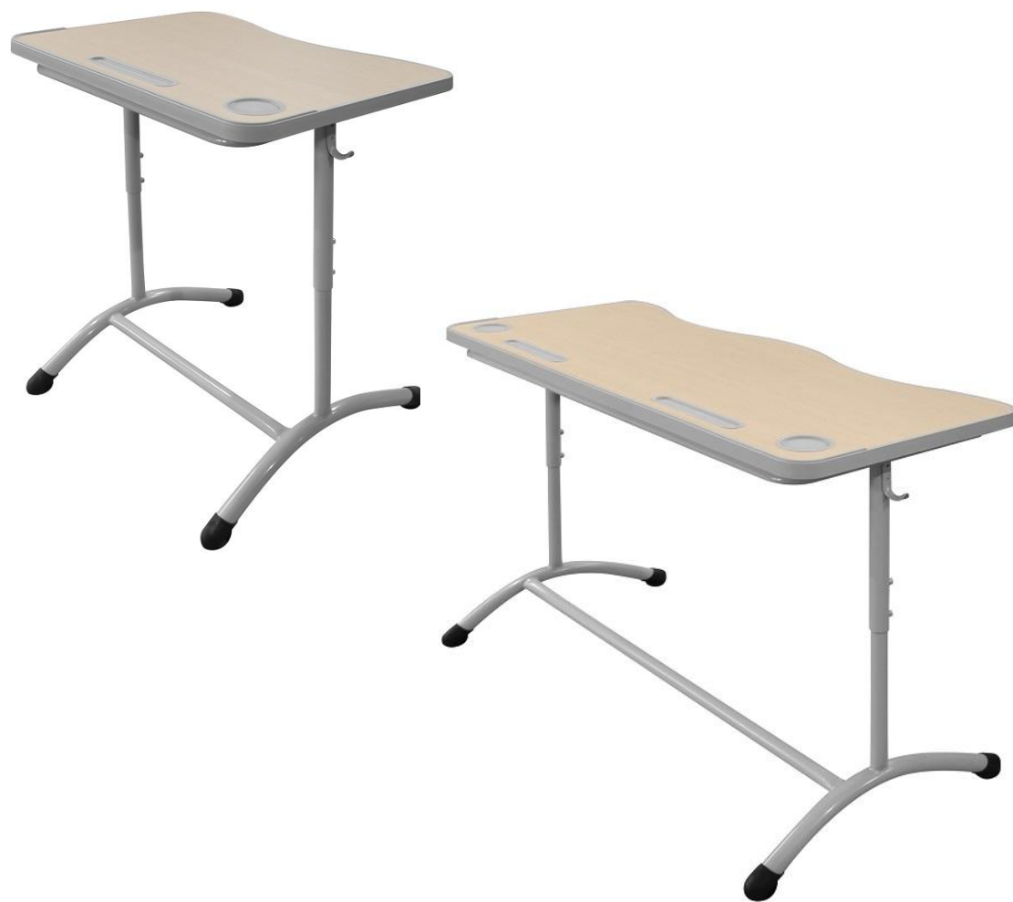
ШСТ51 и ШСТ52