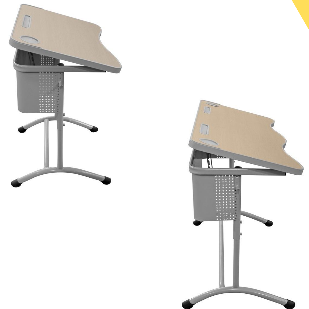
ШСТ55 и ШСТ56 с экраном «колокольчик» + регулировка угла наклона столешницы

Размер 1 местной столешницы 500*700 мм Размер 2 местной столешницы 500*1200 мм