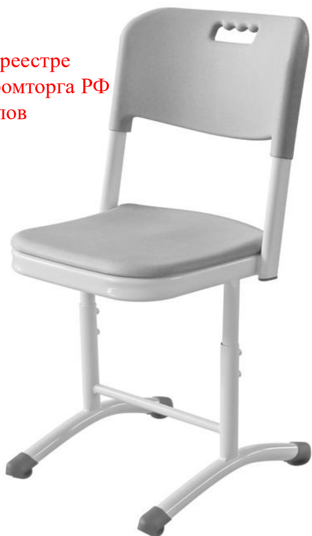
ШС01 (круглая труба)

Регулировка по высоте ШС01, ШС21, ШС61 - 3-5, 4-6 или 5-7 группы роста. Модель ШС40 – 4-6 и 5-7 группы роста