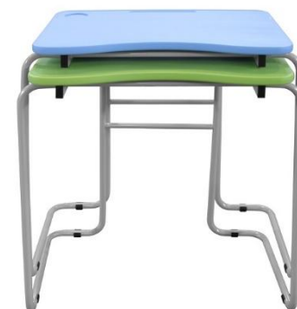
ШСТ60 (МДФ с литой бесшовной кромкой)