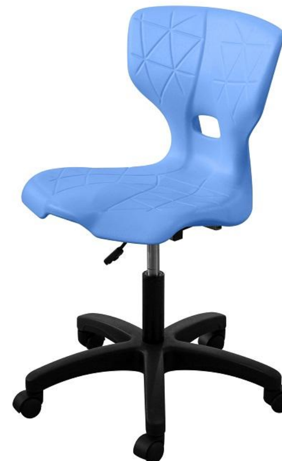
ШС25 газлифт, опора пластик

Высота сиденья регулируется от 460 до 590 мм.