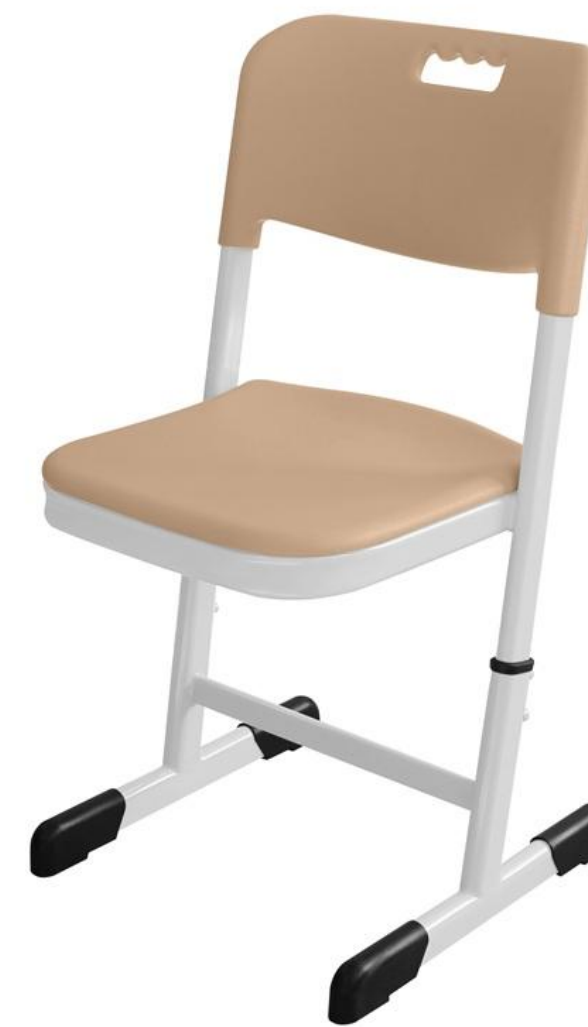
ШС61 (овальная труба)

Ширина 450 мм Глубина 500 мм Высота спинки от 740 до 860 мм