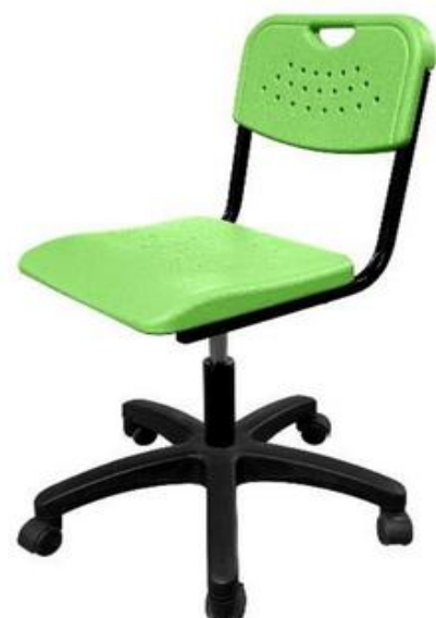
ШС15 (опора пластик)

Все 6 моделей добавлены в Реестр Минпромторга РФ и имеют по 90 баллов