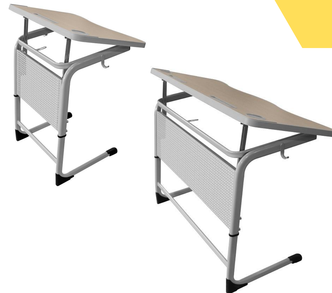
ШСТ65 и ШСТ66 с экраном «колокольчик» + регулировка угла наклона столешницы

Размер 1 местной столешницы 500*700 мм Размер 2 местной столешницы 500*1200 мм