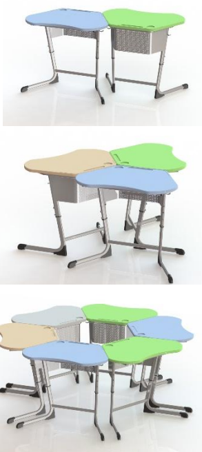
ШСТ78 столешница пластик