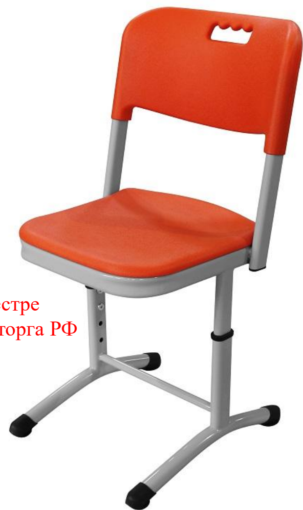
ШС21 (овальная и круглая)

Ширина 410 мм Глубина 480 мм Высота спинки от 680 до 840 мм