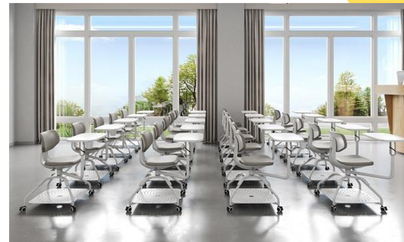
КР25 в интерьере

Разлёт опор 490 мм, высота спинки 800 мм, высота сиденья 490 мм. Столик 330*385 мм. Цвет обивки серый