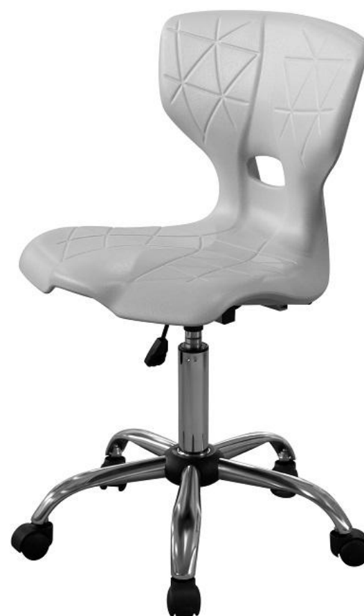
ШС24 газлифт, опора хром

Высота сиденья регулируется от 520 до 660 мм.