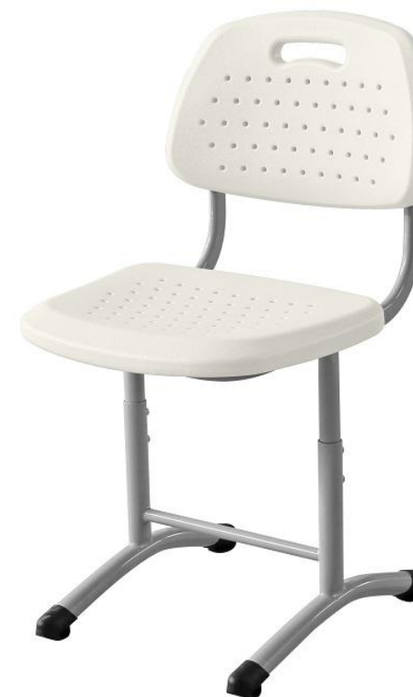
ШС03 (круглая труба)