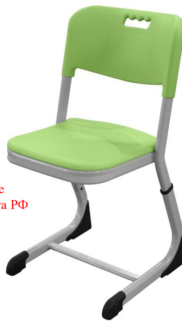
ШС40 (овальная труба)

Ширина 415 мм Глубина 530 мм Высота спинки от 660 до 820 мм