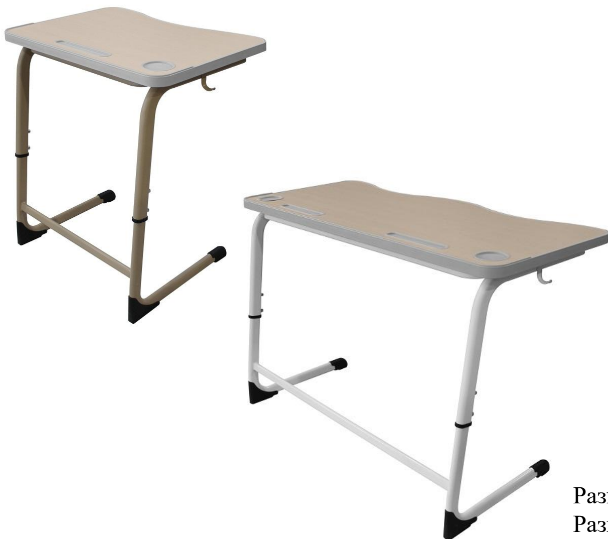
ШСТ61 и ШСТ62