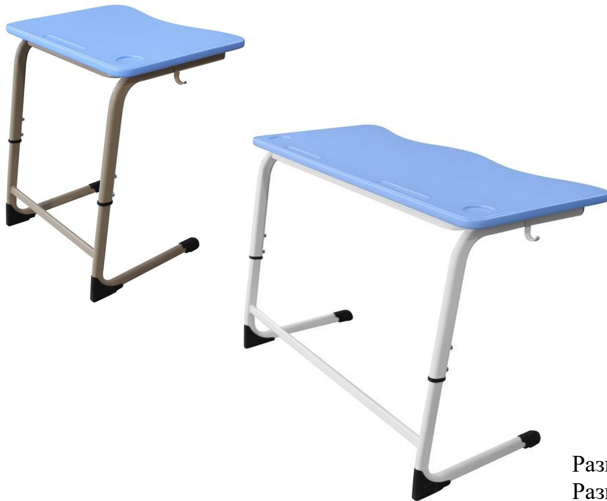
ШСТ21 и ШСТ22