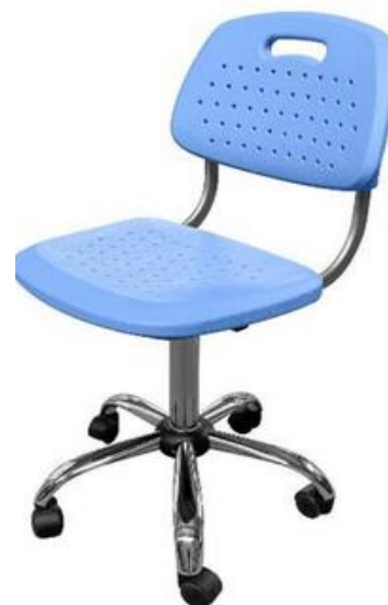
ШС18 (опора хром)