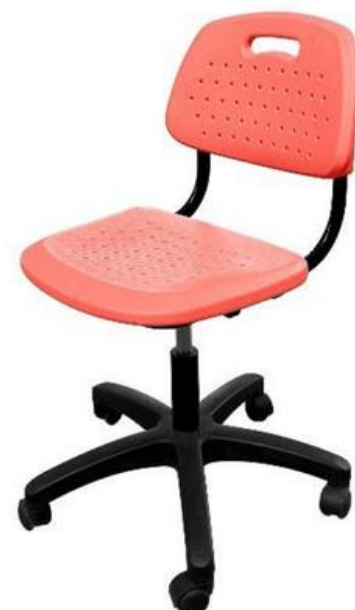
ШС17 (опора пластик)